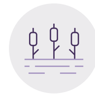
Plaża i Zalew Bagry

Możesz odwiedzić liczne muzea, wspiąć się na Kopiec Kraka lub na wzgórze Lasoty z Fortem św. Benedykta, czy odwiedzić stary kamieniołom. Okolica jest prawdziwą skarbnicą wiedzy o mieście, co pozwoli Ci codziennie odkrywać je na nowo.