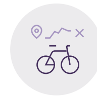
Wiślane Trasa Rowerowa