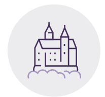
Wawel i Stare Miasto