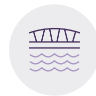
Podgórze i Kładka Bernatka